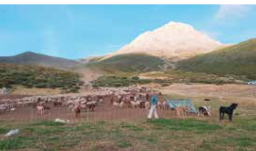
Espigüete, Picos de Europa (León, Espagne), août 2019