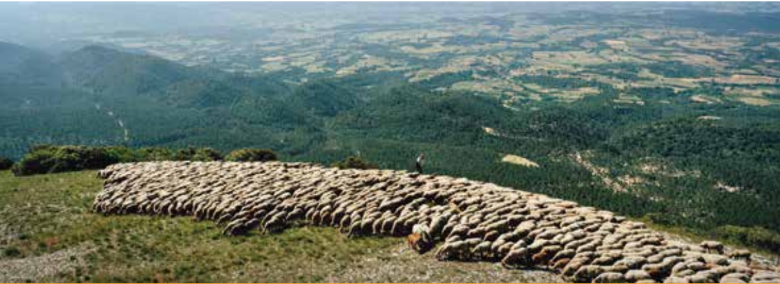
Troupeau GAEC du Mourre Nègre, Parc naturel régional du Luberon (France), juin 2013