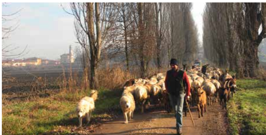
Villastellone (Piémont, Italie), décembre 2014